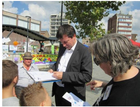
Mr le Bourgmestre s'est prêté au jeu lui aussi !

Dans le cadre de la SEMAINE DE LA MOBILITE , la Ville de Herstal organisait sa première journée de la mobilité ce samedi 20 septembre.