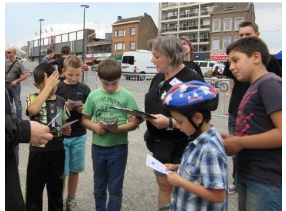
Les enfants ont informé les passants en distribuant des tracts et sont partis à la chasse aux signatures.