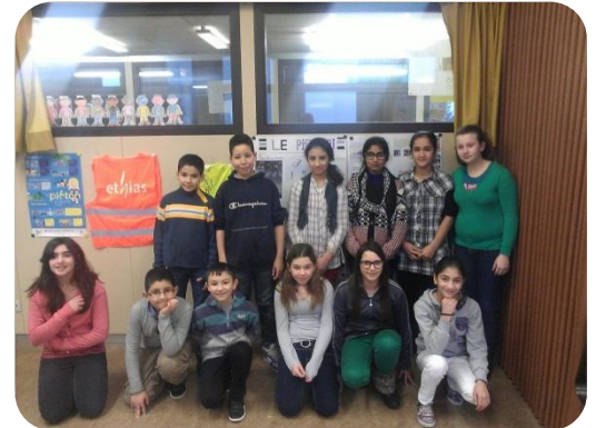
Les élèves de 5 ème - 6 ème de l'école communale de Burenville.